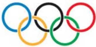
奥林匹克五环标志是由皮埃尔-

德-顾拜旦于 1913 年构思设计的，它是世界范围内最为人们广泛认知的奥林匹克运动会标志。五个不同颜色的圆环代表了参加现代奥林匹克运动会的五大洲：欧洲、亚洲、非洲、大洋洲和美洲。每一个参加奥林匹克运动会的国家都能在自己的国旗上找到至少一种五环的颜色。